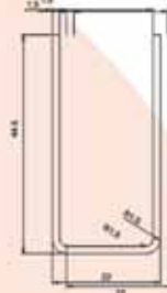
GUÍA 45X25X45 SIN SOLAPE